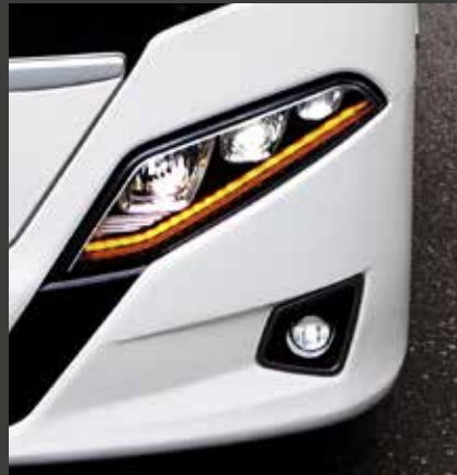
Faróis e lanternas exclusivos.