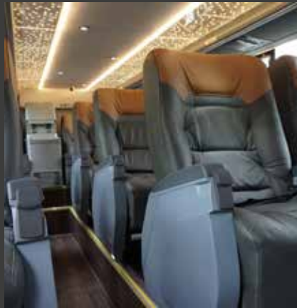
Luz quente oferece maior conforto e aconchego ao passageiro.