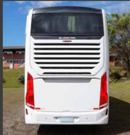
Traseira exclusiva Busscar.