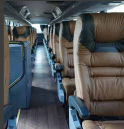
Estilo e sofisticação presentes em todos os elementos do salão.